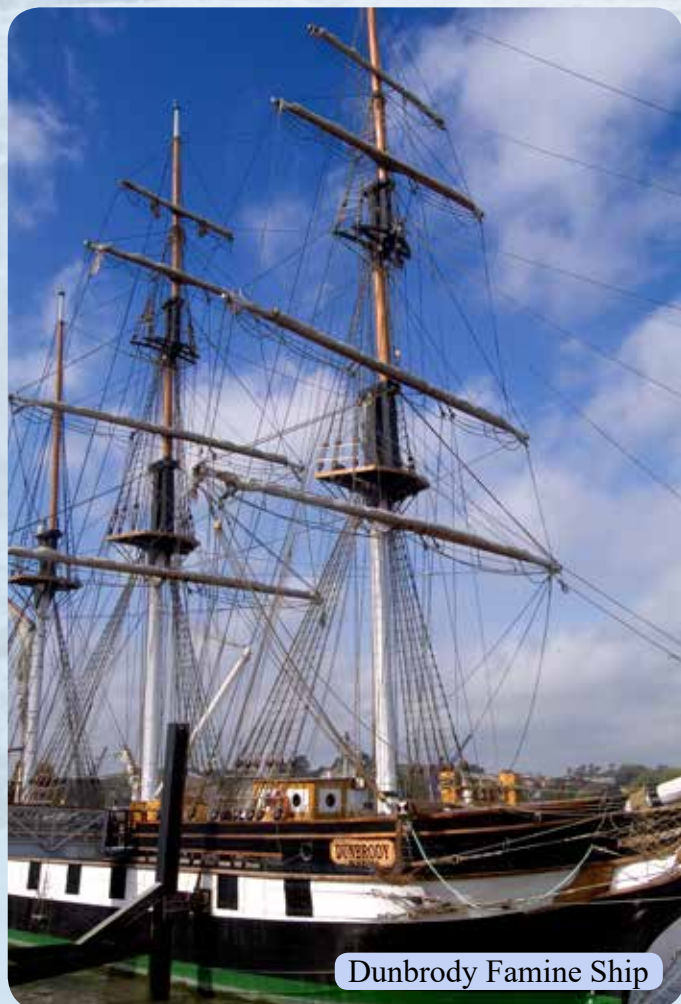
Dunbrody Famine Ship