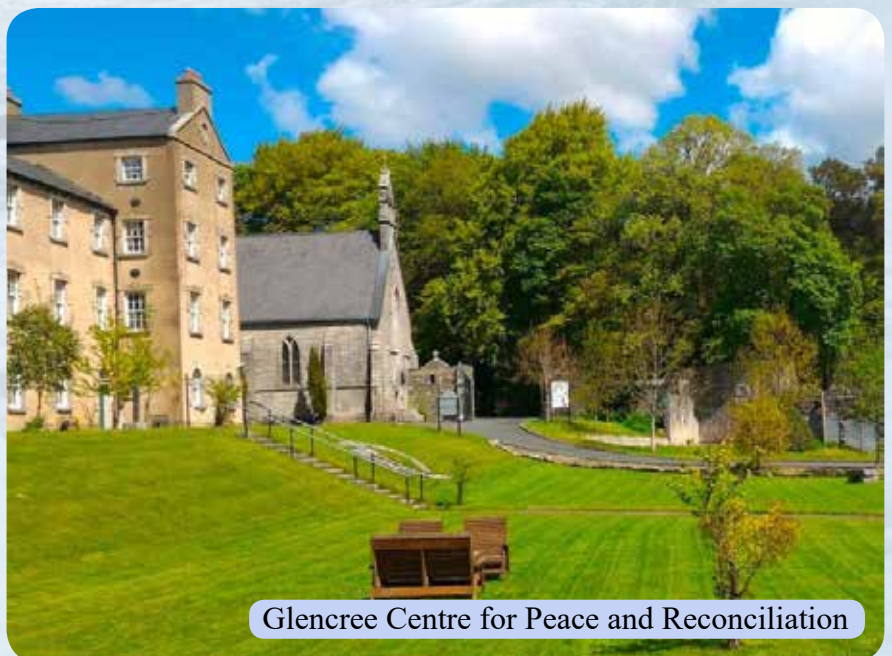
Glencree Centre for Peace and Reconciliation

Den deutschen Soldatenfriedhof (100 m entfernt) besuchen wir auch. Hier können wir gleich zwei Geschichten hören: von den „deutschen Bomben auf Dublin“ und von den „Irischen Liebesgaben“: Wie Irland Butter, Speck und Zucker für die hungernde deutsche Bevölkerung in den ersten Nachkriegsjahren bereitstellte.