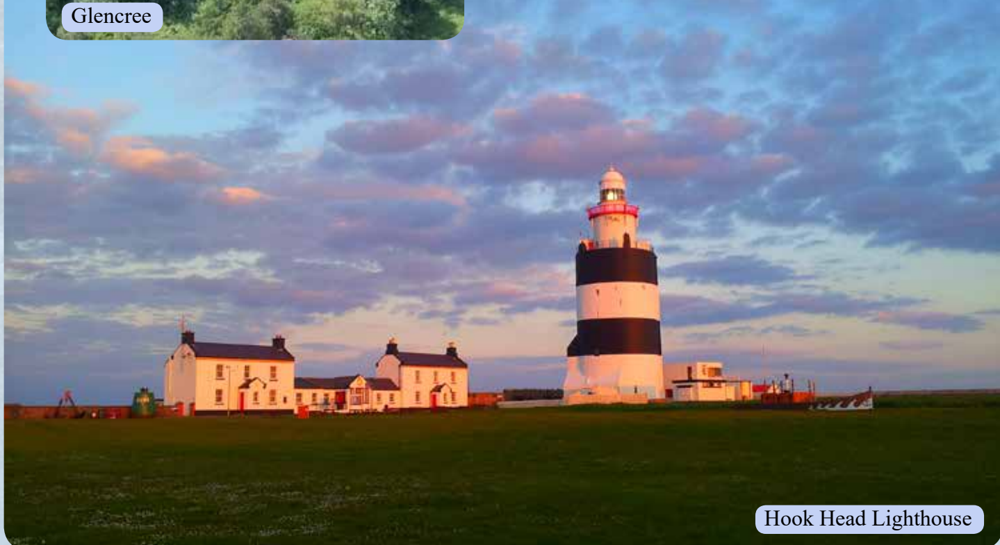
Hook Head Lighthouse